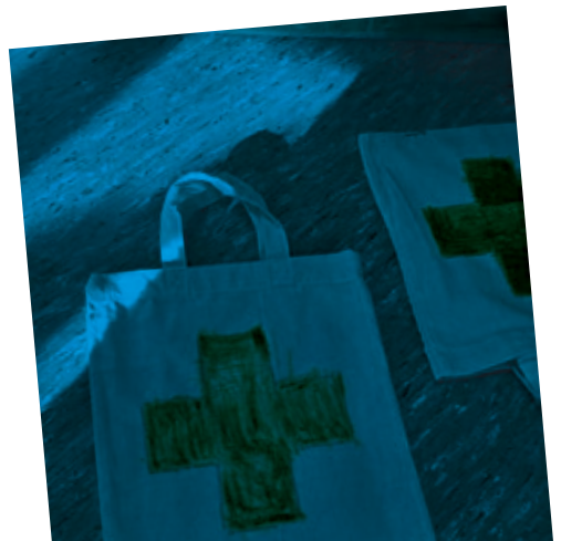
Erste-Hilfe-Kurs „Ben und Mia“ im Zeichen des Roten Kreuzes.