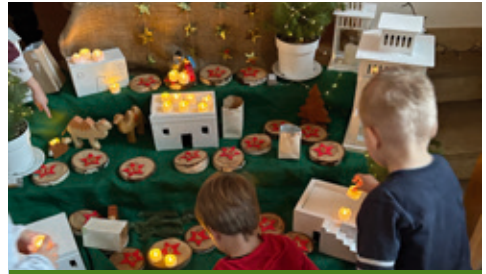
Kinder stellen ein Friedenslicht auf den Krippenweg