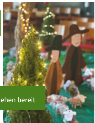
Die Hirten stehen bereit