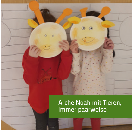
Arche Noah mit Tieren, immer paarweise

Eine Woche lang tauchten die Vorschulkinder des Familienzentrums Dreifaltigkeit spielerisch in die biblische Geschichte der Arche Noah ein und lernten sie auf vielfältige und kreative Weise neu kennen. Mit großer Neugier und Begeisterung setzten sich die Kinder täglich mit verschiedenen Aspekten der Erzählung auseinander.