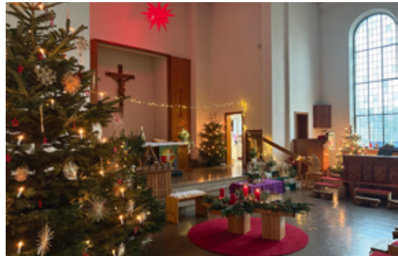
Christuskirche fertig geschmückt