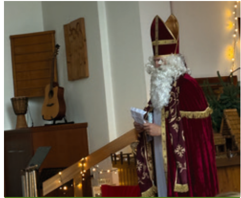
Der Nikolaus zu Besuch