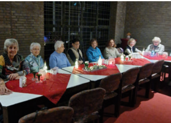
Café zum Sonntag am 3. Advent als „Offene Kirche im Advent“ mit Kaffee und Kuchen, Geschichten und gemeinsamem Singen.