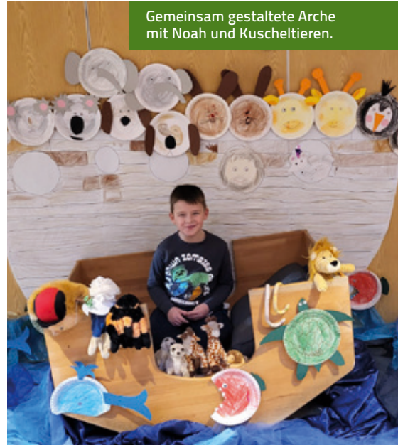
Gemeinsam gestaltete Arche mit Noah und Kuscheltieren.

Religionspädagogisch stand die Kinder-Bibel-Woche im Zeichen von Vertrauen, Gemeinschaft und Gottes Zusage. Die Kinder erfuhren, dass Gott die Menschen und Tiere begleitet und schützt, auch in schwierigen Zeiten. Themen wie Zusammenhalt, Verantwortung füreinander und für die Schöpfung sowie Hoffnung nach der Flut wurden kindgerecht aufgegriffen. So konnten die Kinder religiöse Grunderfahrungen sammeln und entdecken, dass biblische Geschichten auch heute noch etwas mit ihrem eigenen Leben zu tun haben.