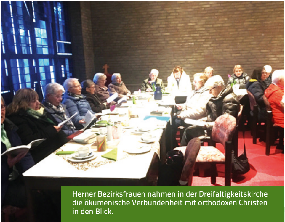
Herner Bezirksfrauen nahmen in der Dreifaltigkeitskirche die ökumenische Verbundenheit mit orthodoxen Christen in den Blick.

Nach weiteren Hinweisen und Einladungen endete die Veranstaltung mit Vaterunser und Segen. BB