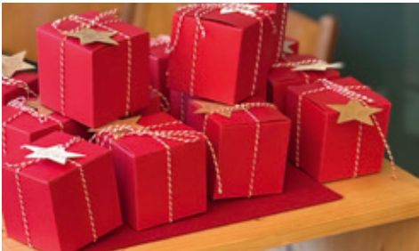
Päckchen mit Glück und Zufriedenheit /Aktion zum Familiengottesdienst dritter Advent