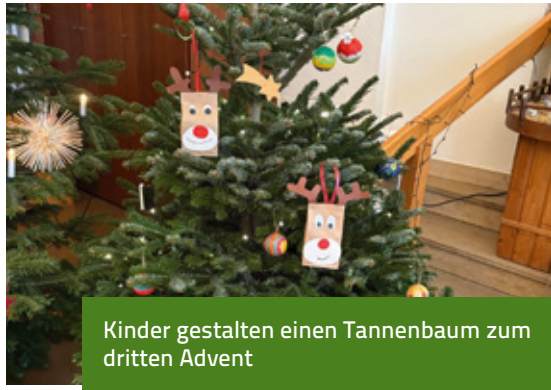
Kinder gestalten einen Tannenbaum zum dritten Advent