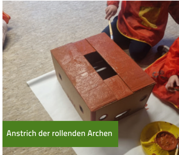
Anstrich der rollenden Archen

Kreativ wurden die Vorschulkinder beim Bau einer eigenen Arche, in die Kuschtiere und Spielzeugtiere – selbstverständlich immer paarweise – einziehen durften. Außerdem malten und bastelten die Kinder zahlreiche Tiere, die anschließend an eine große, gemeinsam gestaltete Arche geklebt wurden.