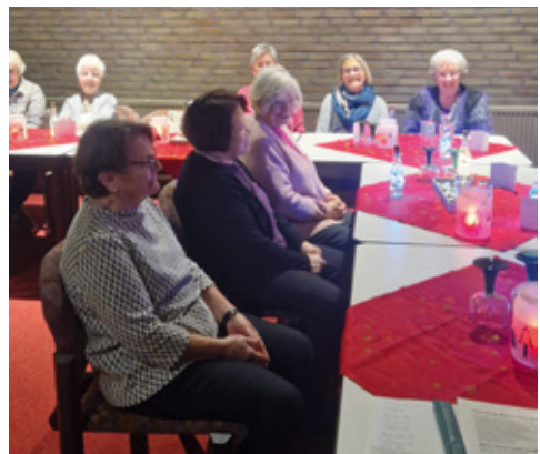
Adventsfeier des Frauentreffs am Regenkamp am 15. Dezember im Seitenschiff der Dreifaltigkeitskirche.