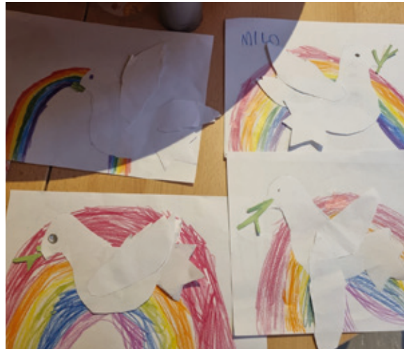
Taube mit Ölweig im Schnabel als Hoffnungszeichen

Ein besonderes Highlight war die Gestaltung einer Leinwand aus Handabdrücken, aus denen fantasievolle Tiere entstanden. Diese bleibt noch einige Zeit im Familienzentrum hängen und lädt auch die anderen Kinder der Einrichtung dazu ein, an der Kinder-Bibel-Woche teilzuhaben.