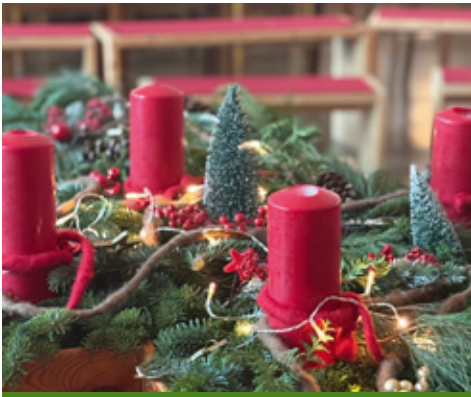
Adventskranz auf unserem Kreuztisch